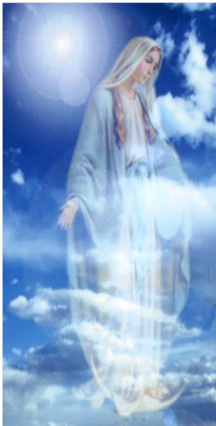
Marie prie Dieu pour qu'Il ait pitié à cause de l'eau